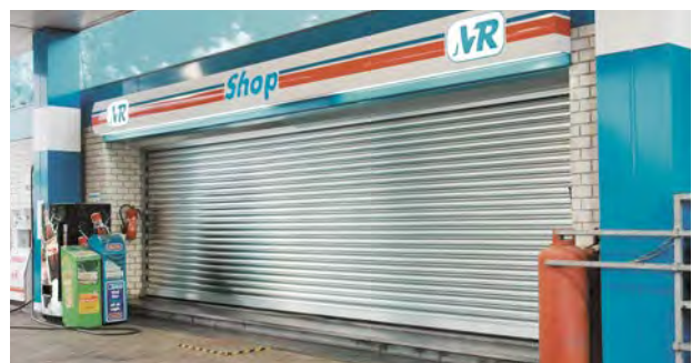
Type stalen rolluiken