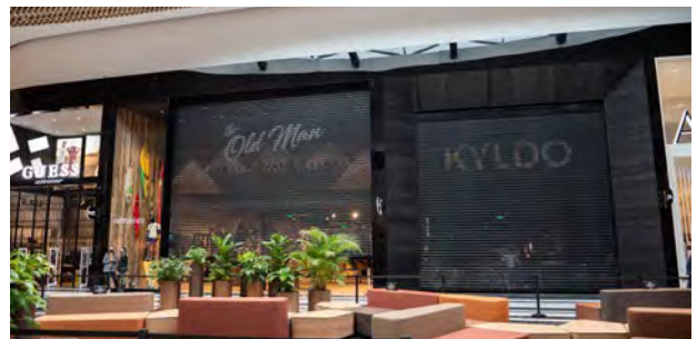
Type geperforeerde rolluiken